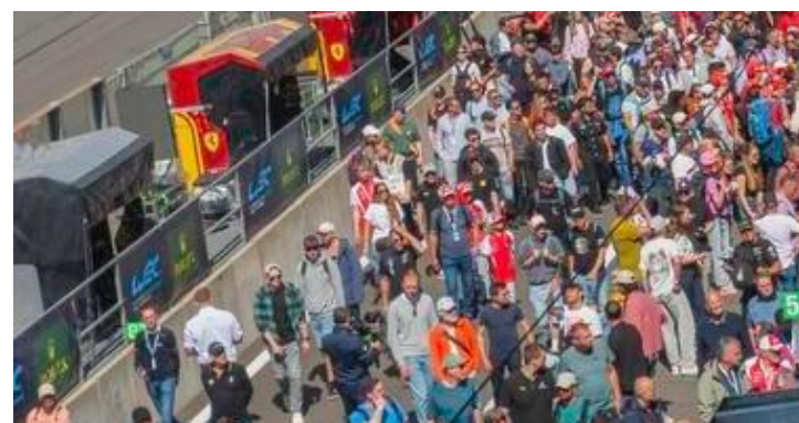
Le public a répondu présent.

plété par la Ferrari #50 d'Antonio Fuoco, Miguel Molina et Nicklas Nielsen. En LMGT3, c'est la McLaren #10 de l'équipe Garage 59 pilotée par Marvin Kirchhöfer, Thomas Fleming