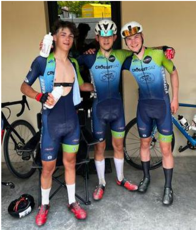
Trois des cinq coureurs du VCA qui ont fait le déplacement en Italie.

Les U17 du Vélo Club Ardennes étaient engagés sur une course par étapes en Italie ce week-end. S'il n'y a pas eu de podium, le bilan global n'en reste pas moins positif pour ces jeunes cyclistes qui ont emmagasiné une précieuse expérience.